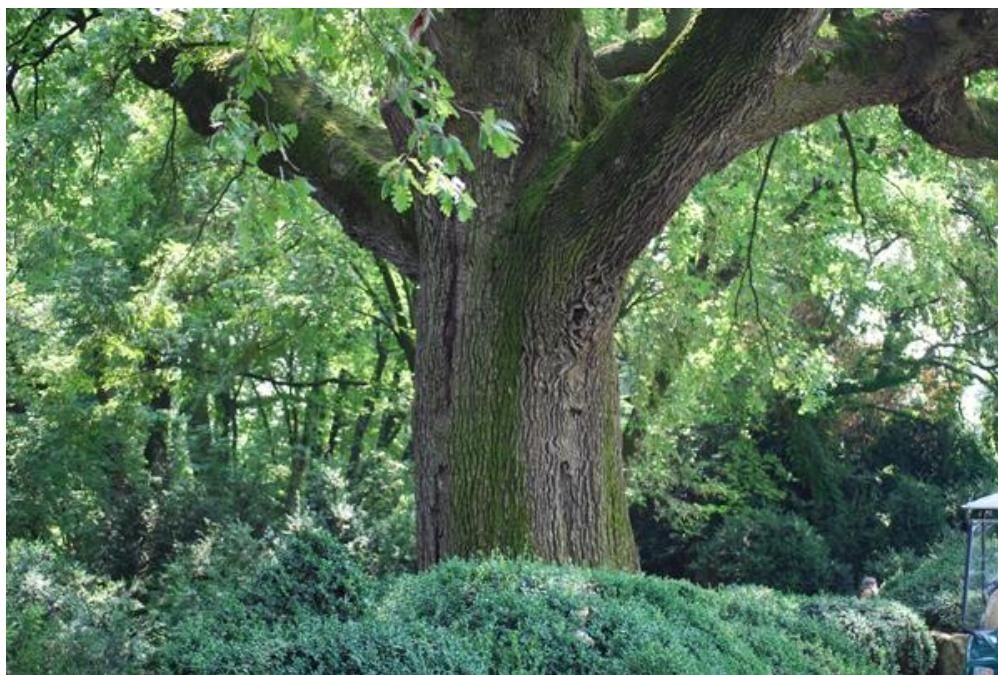
Большой Дуб и Камень Молодости

Идя по основному пути вы встретите Большой Дуб ( Quercus Robur , сем. Fagaceae ), которому 400 лет, - это самое древнее дерево в Парке. Латинское название дерева « Quercus » происходит от кельтского и означает “красивое дерево”. Карло Сигуртá сравнивал огромную крону дерева с куполом собора, поддерживаемого только одним мощным пилястром. Дуб покрывает около 1000 м 2 поверхности, находясь в великолепной гармонии ствола (6 м в диаметре) с кроной (120 м).